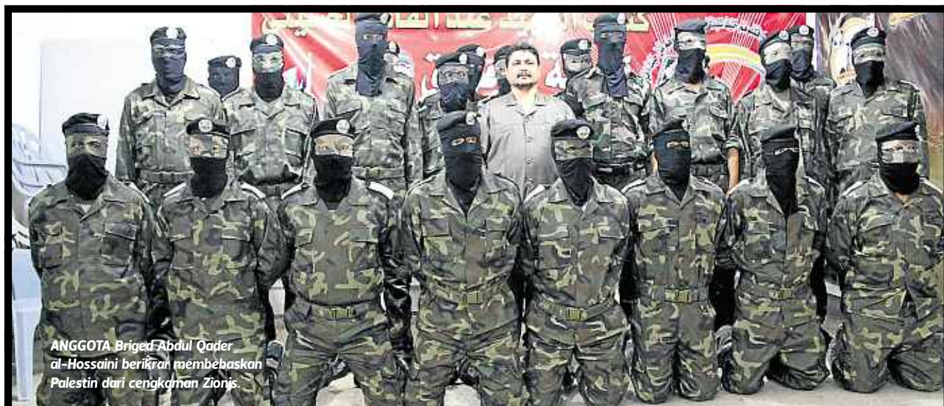
ANGGOTA Briged Abdul Qader al-Hossaini berikran membebaskan Palestin dari cengkaman Zionis.