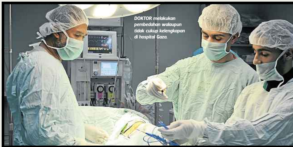
DOKTOR melakukan pembedahan walaupun tidak cukup kelengkapan di hospital Gaza.

Menurutnya, sepanjang seminggu berada di sini, dia mendapati selain kurang ubat-ubatan, doktor di Gaza juga memerlukan peralatan canggih untuk melakukan pembedahan.