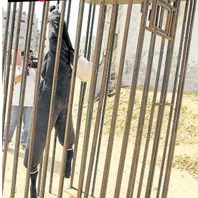
SANGKAR digunakan untuk menyiksa penduduk Palestin.

Gaza (Palestin): Ada antara mereka digantung di dalam sangkar haiwan dan dibiarkan di tengah panas selepas disiksa. Selebihnya dibiarkan bersesak di dalam satu sel yang rata-ratanya disumbat seramai enam hingga 14 orang.