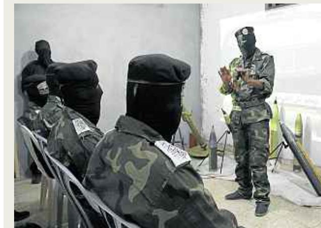
ANGGOTA Briged Abdul Qader al-Hossaini diberikan penerangan oleh ketua mereka.

Gaza (Palestin): Kami bukanlah penganas sebaliknya hanya berjuang mempertahankan kedaulatan bumi Palestin daripada kejahatan tentera Zionis.