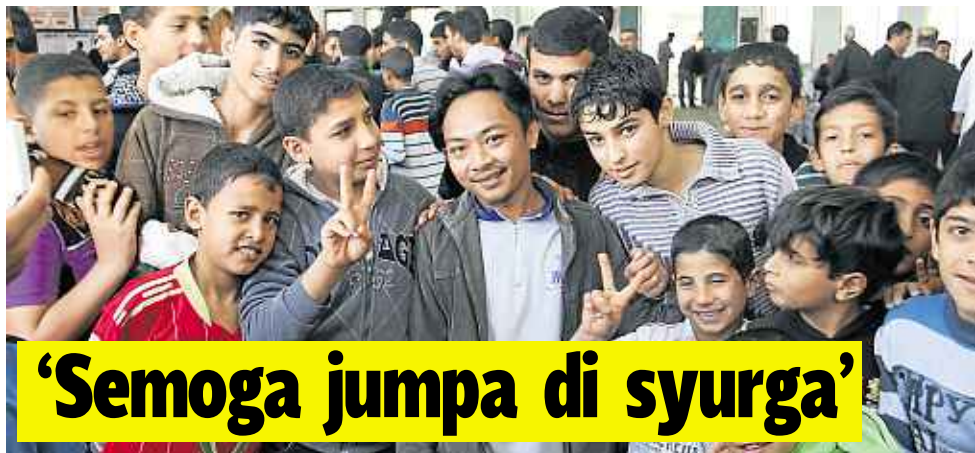
WARTAWAN dikerumuni golongan remaja selepas menunaikan solat Jumaat bersama mereka.