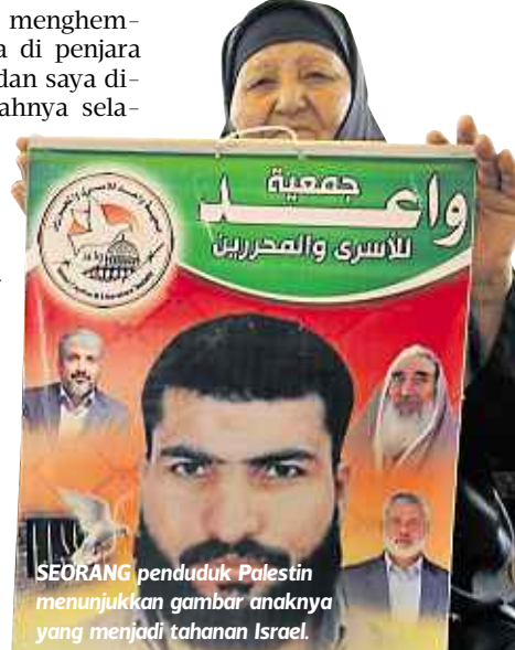
SEORANG penduduk Palestin menunjukkan gambar anaknya yang menjadi tahanan Israel.

Semoga Allah memberkati rohnya dan ditempatkan bersama Mujahiddin yang lain.