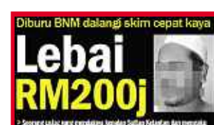
LAPORAN Harian Metro 28 Mei 2011.

Kisah penipuan lelaki berusia 47 tahun mula dilaporkan Harian Metro pada 28 Mei 2011 selepas namanya tersenarai sebagai antara individu paling dikehendaki Bank Negara Malaysia (BNM) sejak Disember 2008 berhubung penipuan skim cepat kaya dan pengambilan de-