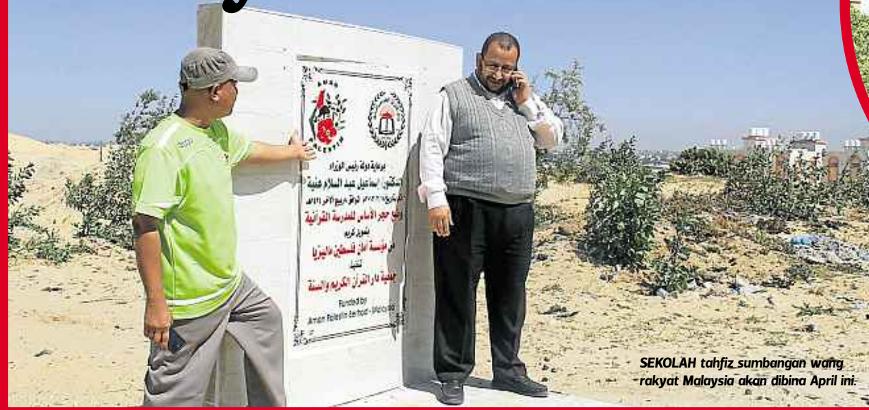
SEKOLAH tahfiz sumbangan wang rakyat Malaysia akan dibina April ini.