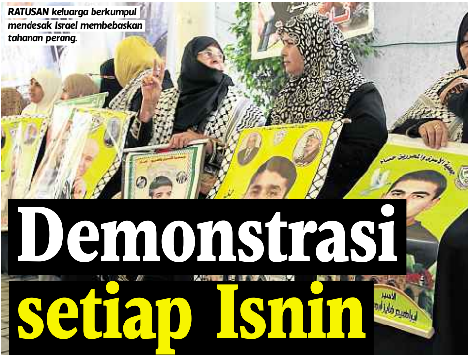
RATUSAN keluarga berkumpul mendesak Israel membebaskan tahanan perang.