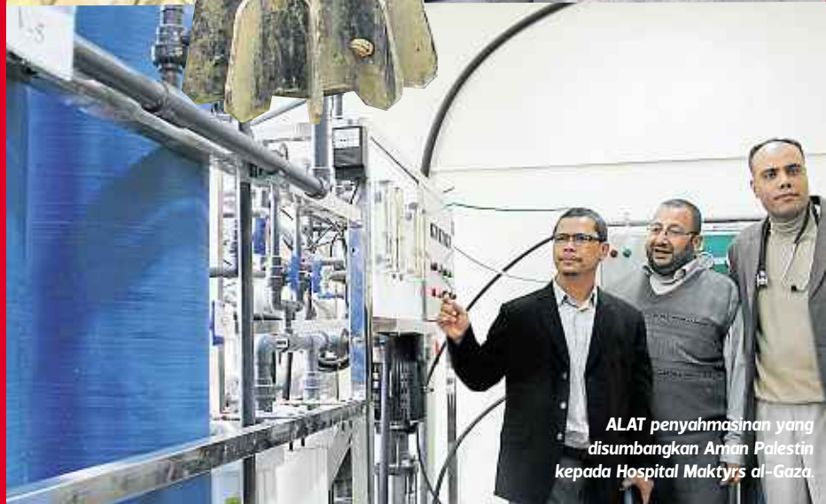
ALAT penyahmasinan yang disumbangkan Aman Palestin kepada Hospital Maktyrs al-Gaza.