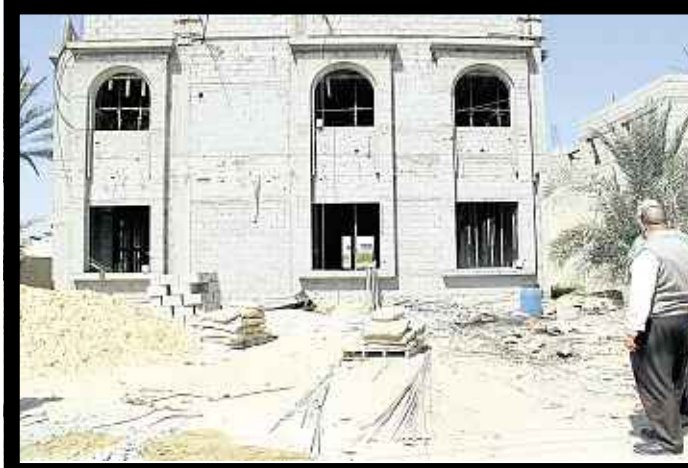
MASJID al-Qassam yang masih dalam proses pembinaan semula.