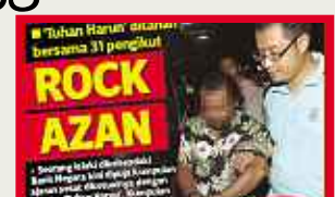
LAPORAN Harian Metro kelmarin.